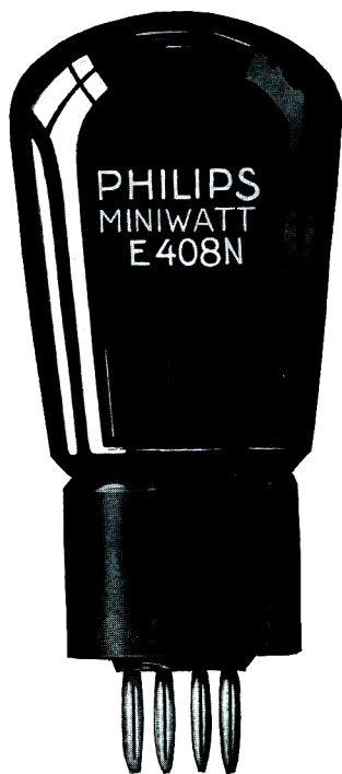
\frac{3}{4} nat. Gr.

Die E 408 N hat einen höchstzulässigen Anodenverlust von 12W und eignet sich für Verwendung als Endverstärkerröhre in Rundfunkempfangsgeräten, sowie in Verstärkern zum Betriebe von 3 bis 4 elektromagnetischen oder einem oder mehreren elektrodynamischen Lautsprechern für Wohnzimmer oder für kleine Säle.